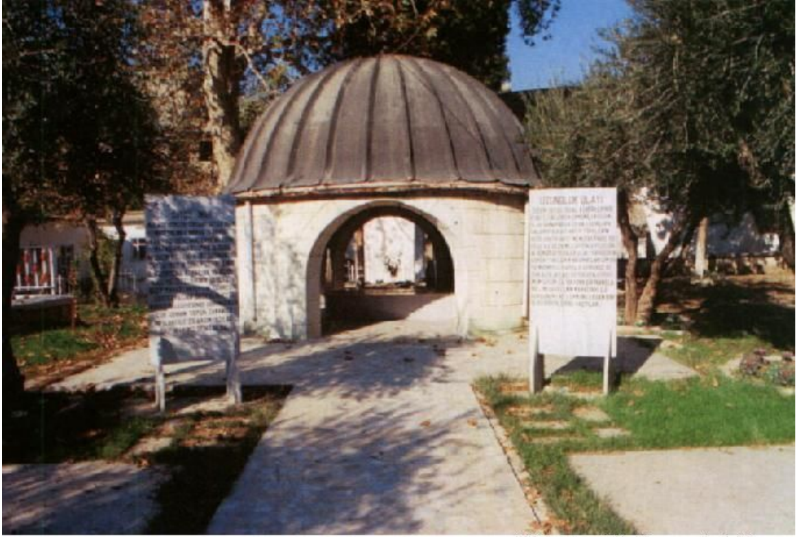
K. Maraş, Sütsüimam Anıt Mezarı