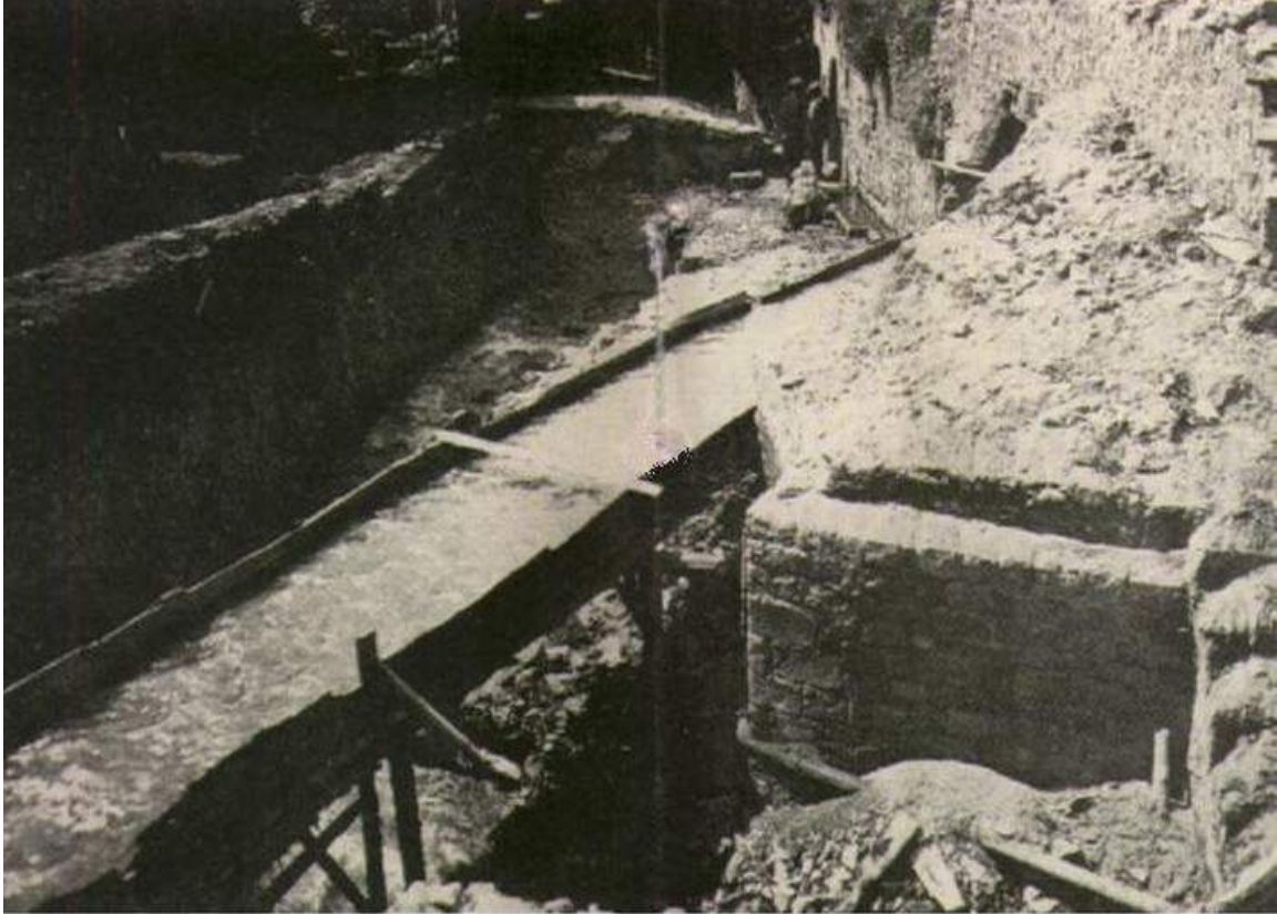
Maraşın Kurtuluş Savaşı Sonrası Görünümü

1 Şubat 1920 tarihinden itibaren savaş şiddetini daha da arttırmaya başladı. O gün Fransızlar çarşığı ateşe verdiler. Mevlevihaneyi, Üdürgücü Camii'ni ve Belediye Dairesi'ni yaktılar. Şehir yangın alanına döndü.