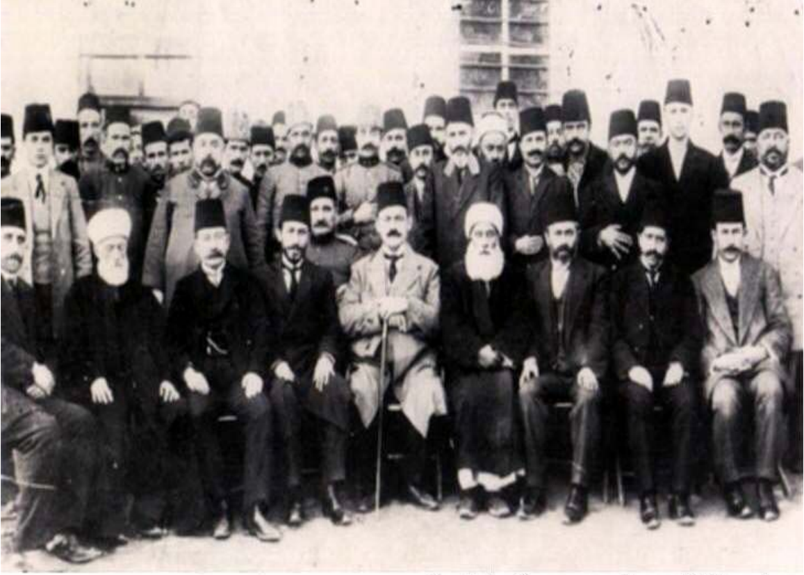
Kurtuluş Savaşının Manevi Mimarları