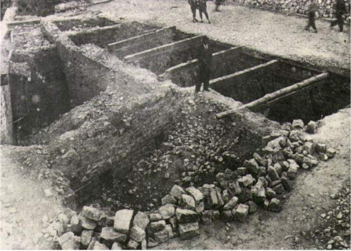
Maraş'ın Kurtuluş Savaşı Sonrası Görünümü