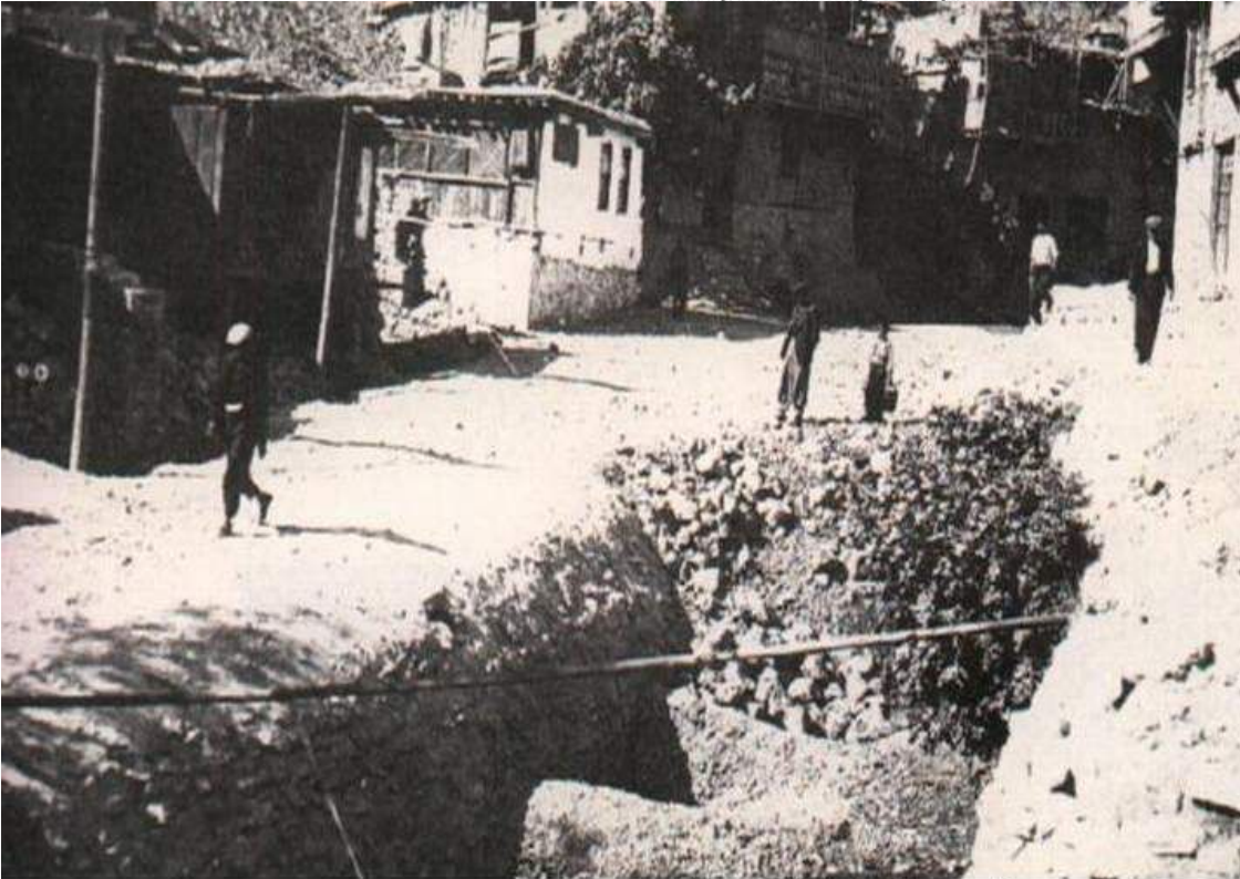
Maraş'ın Kurtuluş Savaşı Sonrası Görünümü

2 Şubat 1920 günü Yürük Selim Göksun ve çevresinden topladığı seksen süvari ve 120 piyade ile Maraş'a gelerek, Sulutarla mevkiinde düşmanla savaşa başladı. Kuzey taraftan başlatılan bu saldırı, arazinin açık ve örtüsüz olması nedeniyle başarısız oldu.