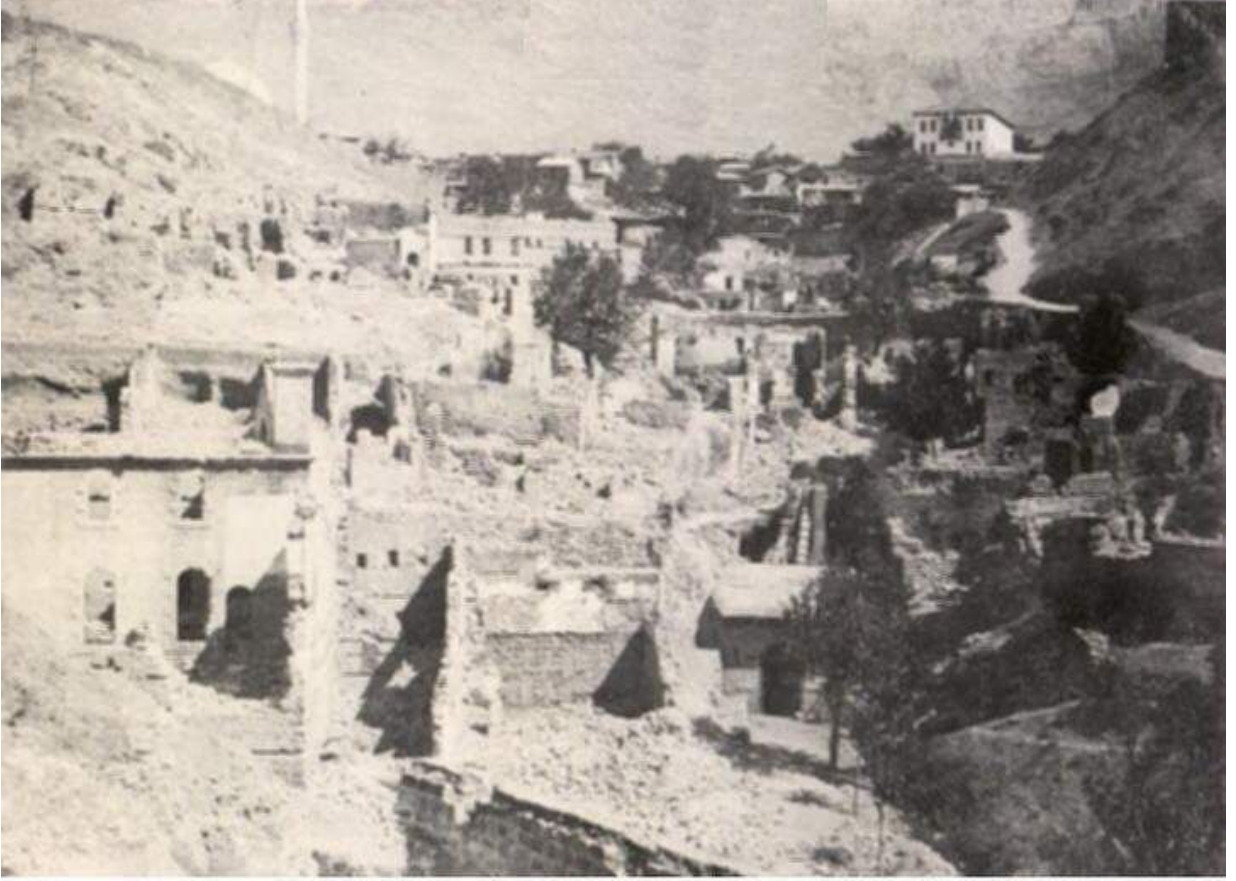
Kurtuluş Savaşından Sonraki Yanan Yıkılan Maraş ( Acemli Mahallesi ) 1920